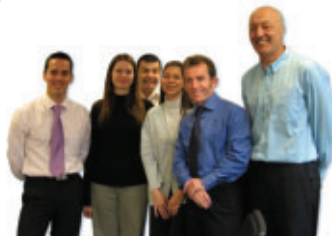
L'équipe du pôle de compétences en Gestion de Configuration

Il permet de répondre selon une approche globale et professionnelle aux problématiques de gestion de configuration de nos clients.